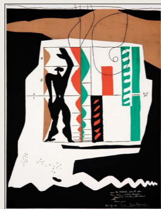
Modulor, 1952, Lito 73,4 x 54,2 cm