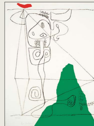
Taureau I, 1964, Lito 72 x 54 cm