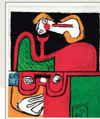
Portrait, 1960, Lito 76 x 64 cm